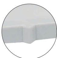
Značka pro zarovnání