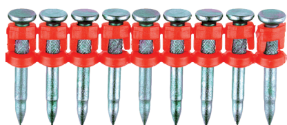
XHA kalibrované prémiové hřeby pro plynovou hřebíkovačku FORCE ONE