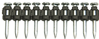
TKA kalibrované standardní hřeby pro plynovou hřebíkovačku FORCE ONE